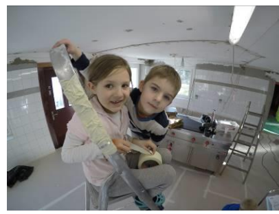
Beim Malen halfen auch die Kleinsten mit