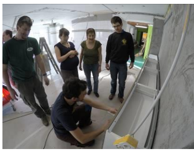
Die neue Küche im Bau