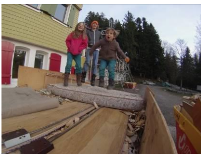
Zu sanierende Räume wurden geräumt

Das traditionelle Renovationsweekend fand im Winter 2015/16 statt. Alle Beteiligten erledigten Arbeiten im Zusammenhang mit der Vorbereitung zur Sanierung der 5. Etappe. So mussten z.B. die ganzen Küchengeräte demontiert und zwischengelagert werden.